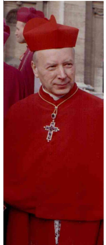
Ksiądz Kardynał Stefan Wyszyński Prymas Polski 1948-81 Arcybiskup Metropolita Gnieźnieński i War- szawski (1948-81)

Przyrzekamy uczynić wszystko, co leży w naszej mocy, aby Polska była rzeczywistym królestwem Twoim i Twojego Syna, poddanym całkowicie pod Twoje